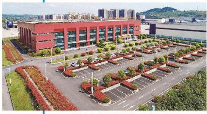
国家电子商务示范基地泸州进口商品展示展销中心。