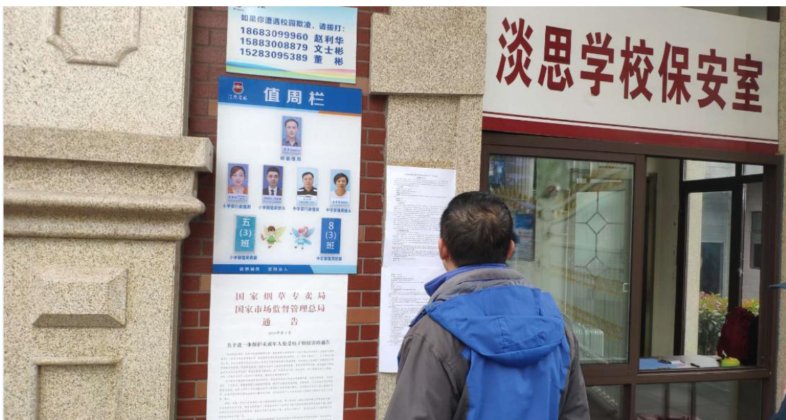
江北学校（淡思校区）