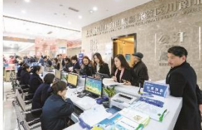
中国(四川)自由贸易试验区川南临港片区办事大厅。