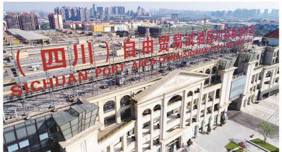
中国(四川)自由贸易试验区川南临港片区大厦。