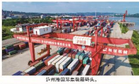
泸州港国际集装箱码头。