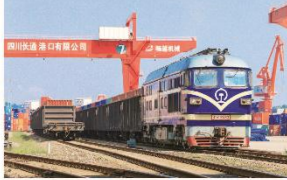
中国(四川)自由贸易试验区川南临港片区泸州港开行铁海联运班列。