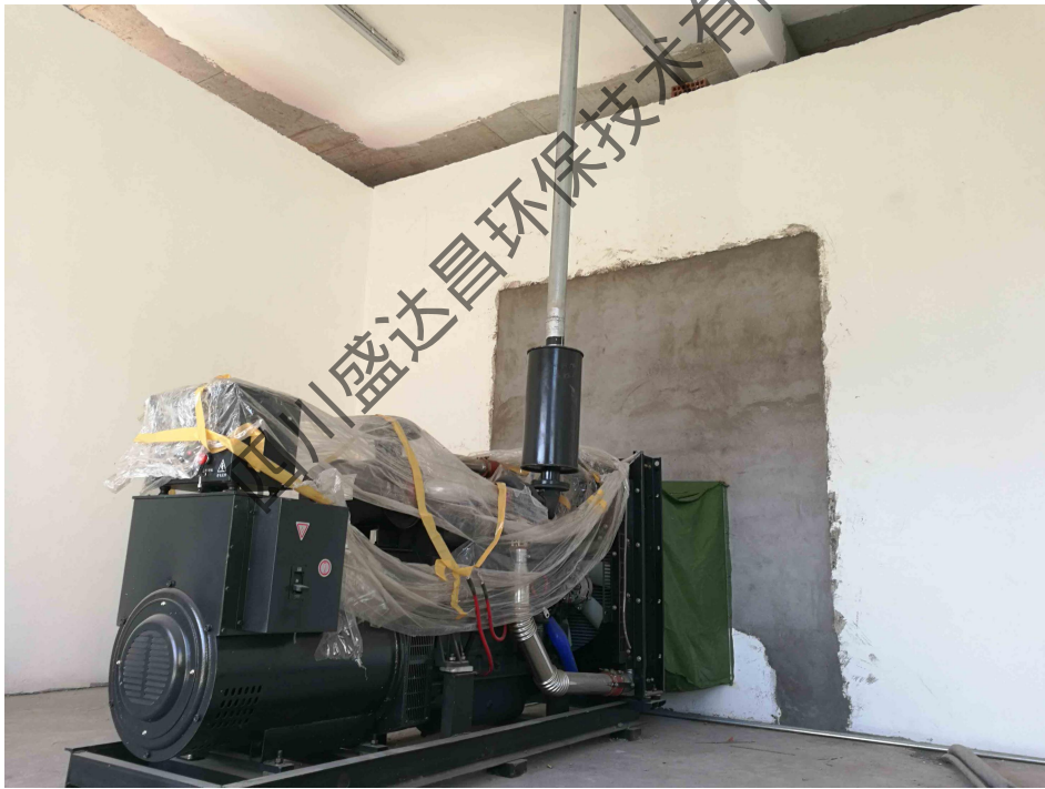
图 4-3 项目 D 区柴油机及排气管道现状