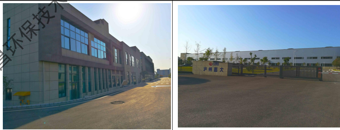
图 4-1 项目 D 区主体工程现状现状