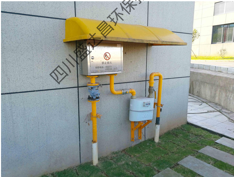
图 4-5 项目 D 区燃气表现状照片