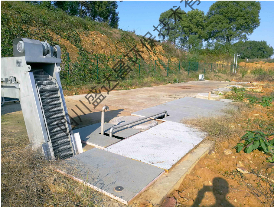
图 4-8 项目 D 区污水预处理设施现状照片