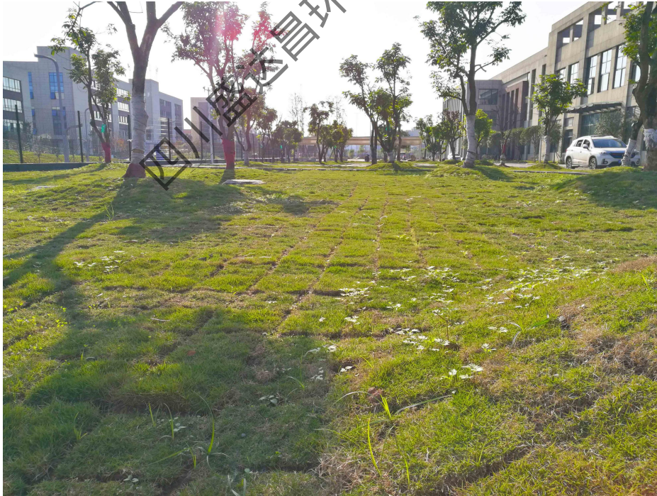
图 4-14 项目 D 区绿化现状

工程项目原报告表综合技术指标与实际基本一致，项目实际综合技术指标一览表见表 4-1。