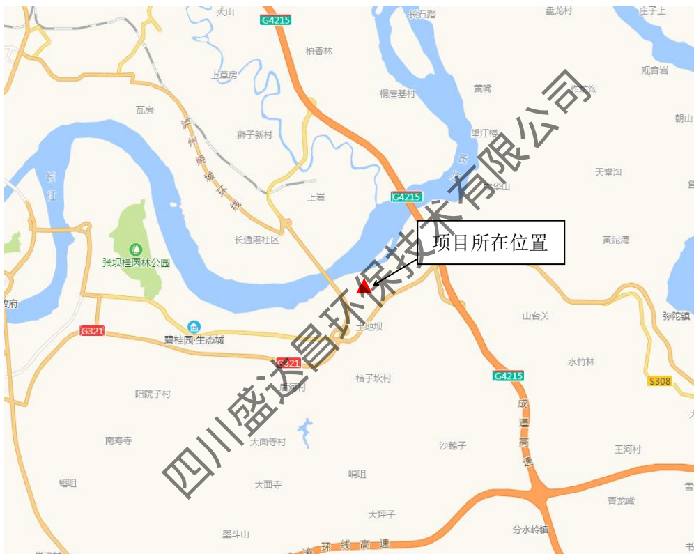
图4-16 项目所在位置示意图

项目位于泸州市高新产业园区内，项目西侧为工业二路，南边为酒业园路，东侧为经四路，项目北侧为滨江路，项目具体地理位置如图4-10所示。