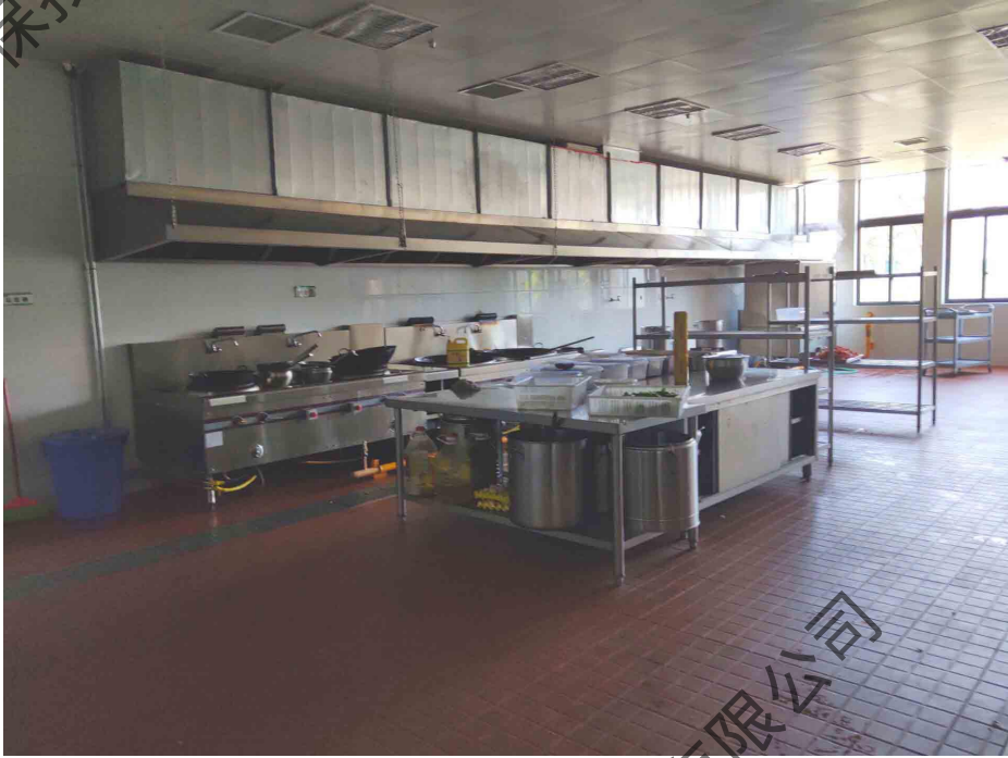
图 4-13 项目 D 区食堂抽油烟机现状照片