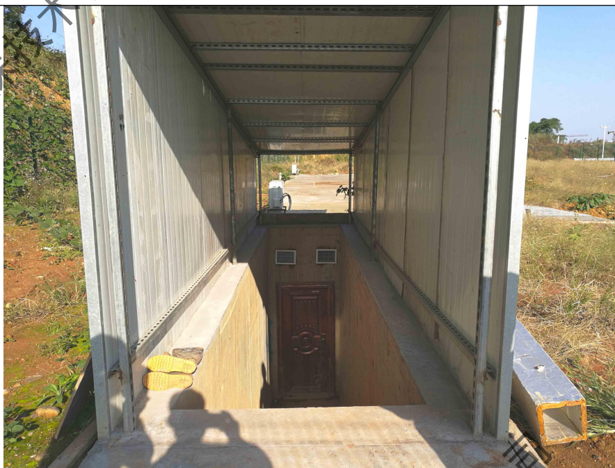
表 4-9 项目 D 区污水预处理设施入口现状照片