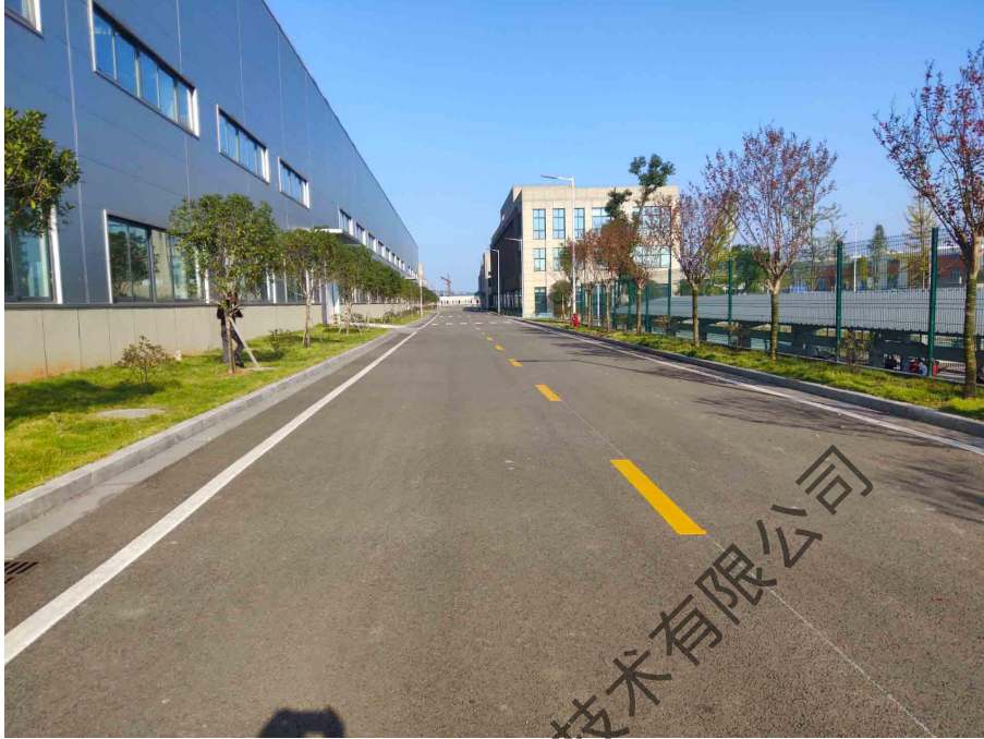
图 4-11 项目 D 区道路硬化现状照片

项目 D 区硬化工程主要为道路及地面停车场，项目 D 区内道路主要沿厂房敷设，地面停车场主要位于项目 D 区南侧，停车位共有 376 个。