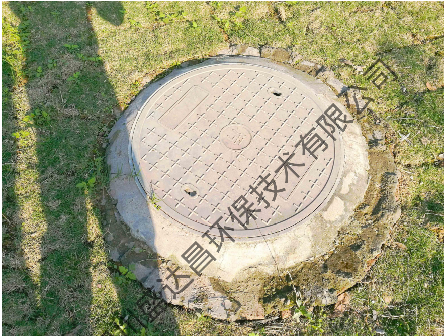
图 4-6 项目 D 区化粪池现状照片

本项目 D 区共设置了 1 个化粪池，容量为 50 m 3 ，主要用于处理厂区生活污水，厂区生活污水经化粪池预处理后排入市政污水管网。经现场调查核实，化粪池位于项目 D 区东南角的绿化带内。