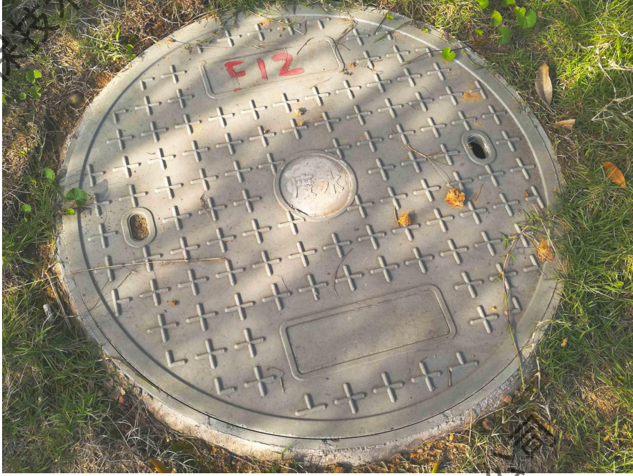
图 4-7 项目 D 区废水井现状照片