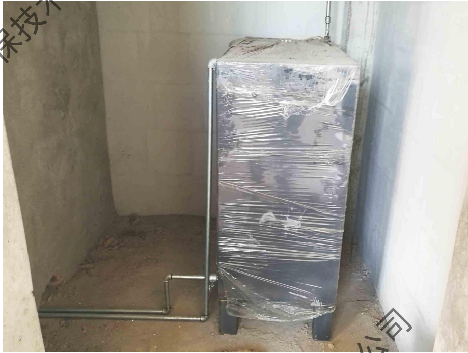
图 4-4 项目 D 区柴油储箱现状照片