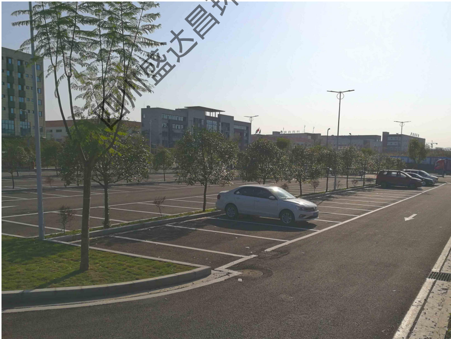
图 4-12 项目 D 区南侧地面停车场现状照片