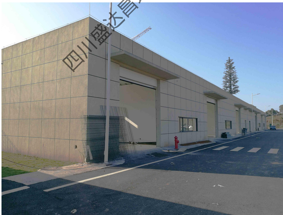
图 4-10 项目 D 区垃圾库现状照片

经现场调查核实，项目 D 区西侧设有一个垃圾库，垃圾库主要用于临时堆放厂区固体废弃物（非危废）及生活垃圾，垃圾库里临时堆放的固体废弃物定期由市政环卫部门统一清运。