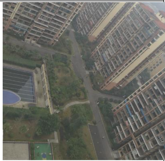
一二期绿化（俯视图）