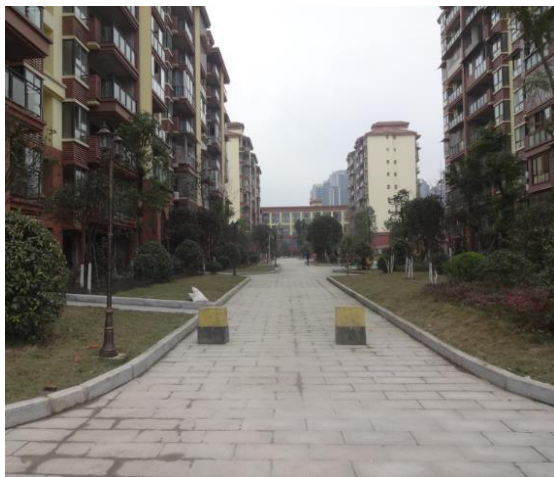
建筑之间硬化地表