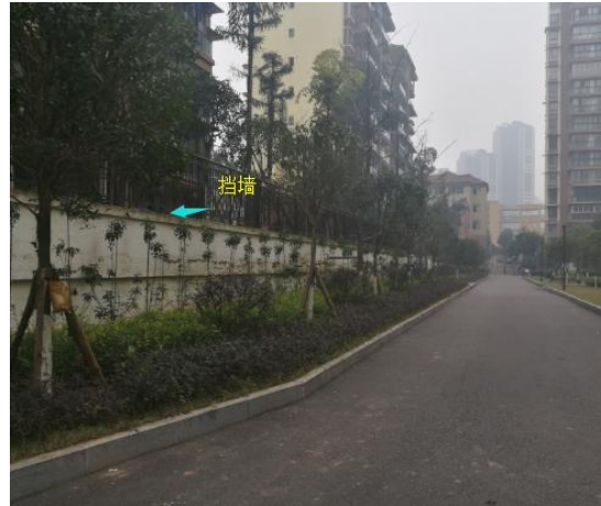
二三期分界线绿化及挡墙