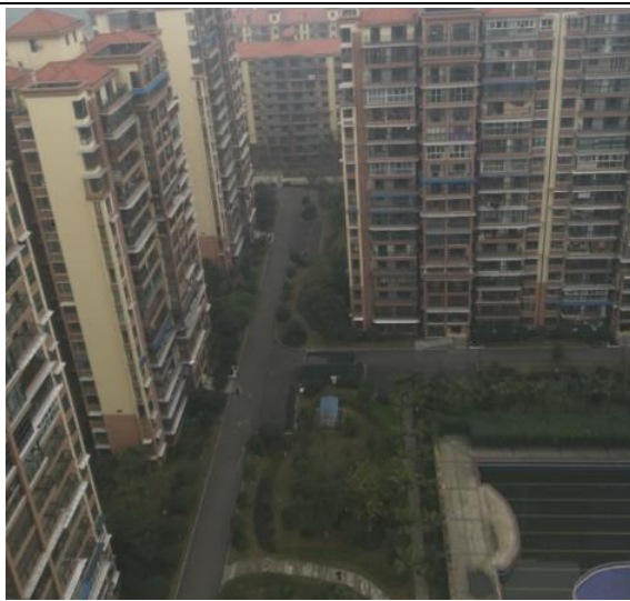
一二期绿化（俯视图）