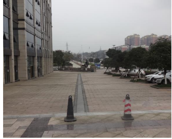
北面硬化铺装地面