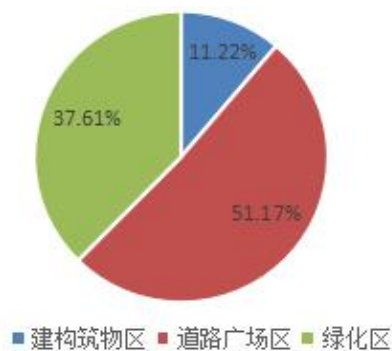
图 4 新增水土流失量分析图

由上表 5-6 可知：各区产生水土流失量因道路广场区和绿化区面积较大，水土流失量最大，最小为建构筑物区。整个项目区从 2014 年 6 月至 2018 年 12 月共产生水土流失量约 964.26t，而原生地面侵蚀量为 364.65t，工程竣工后，水土流失得到了治理，地面侵蚀模数减小，故与原生侵蚀量相比，新增水土流失量为