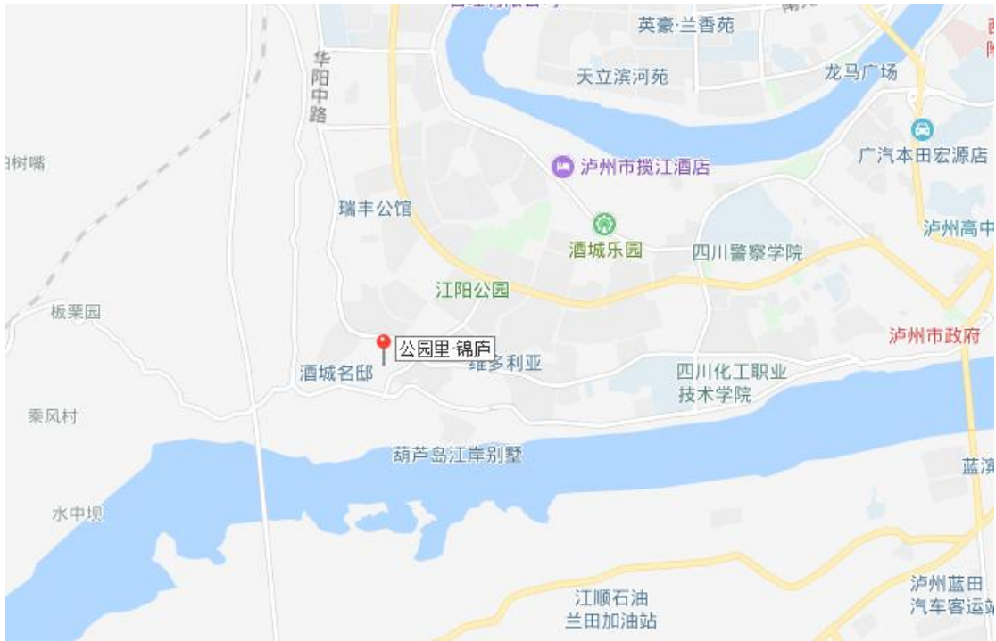
图 1 地理位置图

公园里·锦庐房地产开发建设项目（一期）位于泸州市江阳区城西新区龙池路西侧（华阳街道办事处办公楼背后），处于江阳区规划区范围内，项目场地属江阳区华阳乡长丰村，行政区划属于华阳办事处。地块北临华升南路（学院西路），东临龙驰路，南临华阳街道办事处及 S307，西临规划道路及建设小区，周边市政道路密布，交通条件较为优越。见图 1 和附图 1。