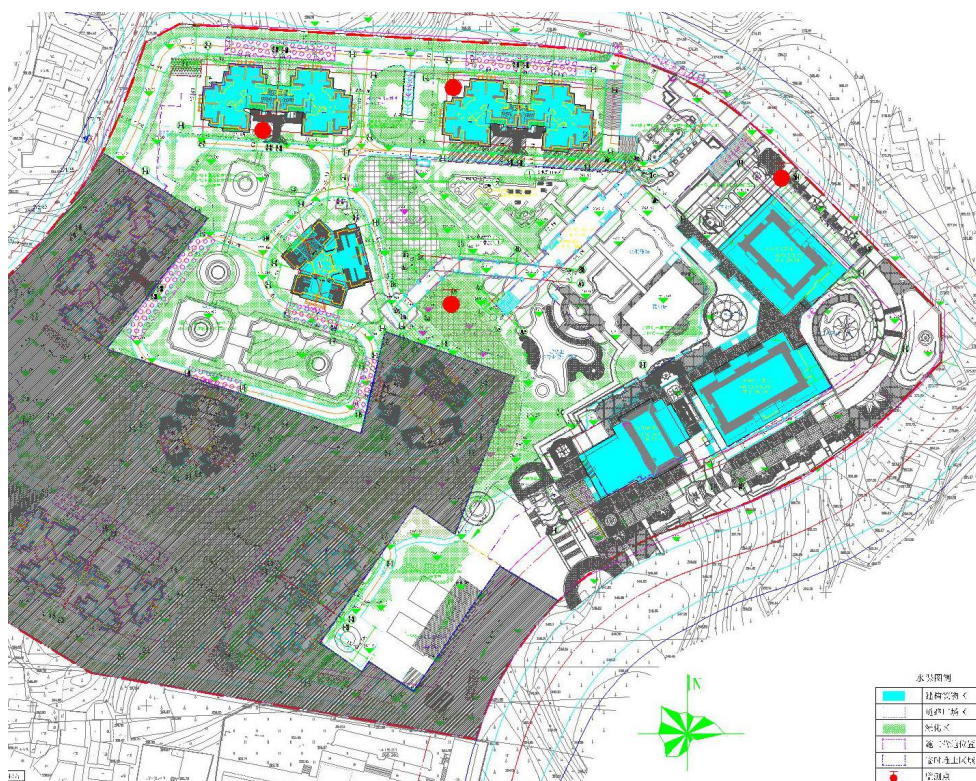
图 2 监测调查点位分布图